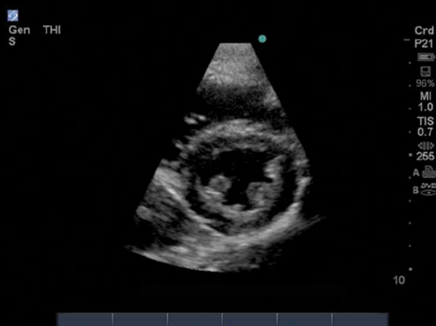
Paraesternal eixo curto coração