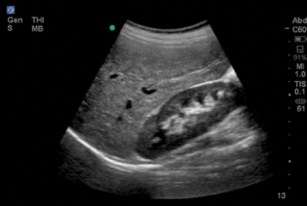
Fígado, rim direito