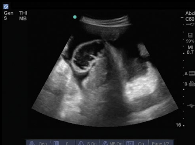
Abdome – Pelve – Líquido Livre