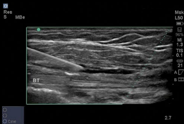
Injeção de ombro com SonoMBe